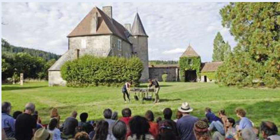
Festival Le Bruit de la musique, Limousin

L'ingénierie culturelle, c'est une multitude de métiers au service de l'art et des territoires, des sites historiques et des lieux de diffusion de la création, institutionnels, alternatifs ou marchands. Englobant des missions de développement et de médiation, d'animation et de conservation, c'est aussi un secteur en nécessaire réinvention, à l'heure où la mutation des pratiques culturelles impose de repenser le lien entre l'art et les citoyens.