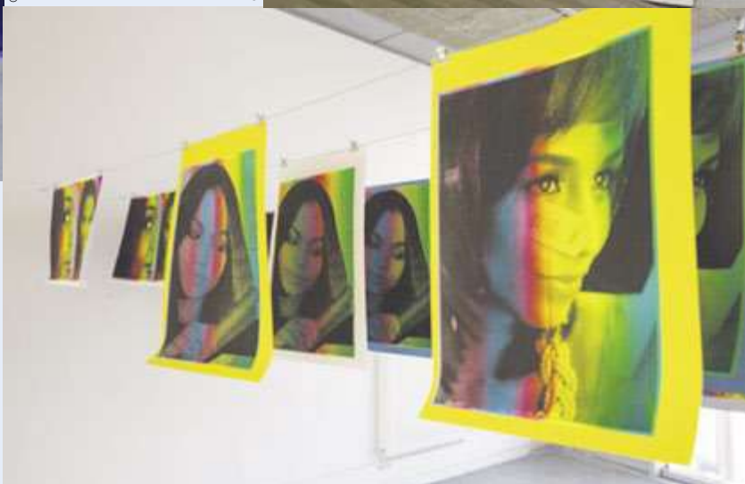
EBABX © Elsa Prudent

D'abord, une très grande ténacité : ce sont des études difficiles parce qu'elles demandent une grande exigence personnelle. Il faut accepter de passer par des moments de doute et avoir le désir de produire : c'est aussi en expérimentant et en montrant son travail que l'on avance. Il faut encore être ouvert, avoir envie de travailler avec d'autres... Outre cet engagement dans les études, nous attendons surtout des élèves un point de vue, une position et un sens critique qui leur permettront de porter un regard sur le monde et de faire des propositions artistiques avec l'accompagnement et les outils techniques et théoriques que l'école leur apporte.