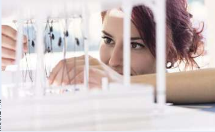
ESDL © Paul Robin