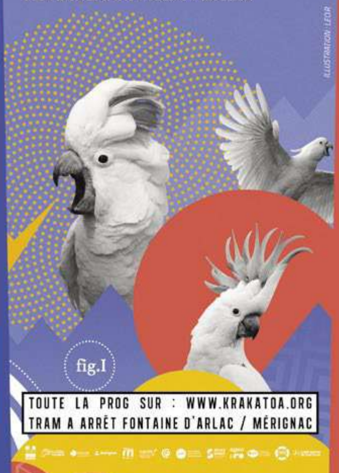
ILLUSTRATION : LÉO P

TOUTE LA PROG SUR : WWW.KRAKATOA.ORG TRAM A ARRÊT FONTAINE D'ARLAC / MÉRIGNAC