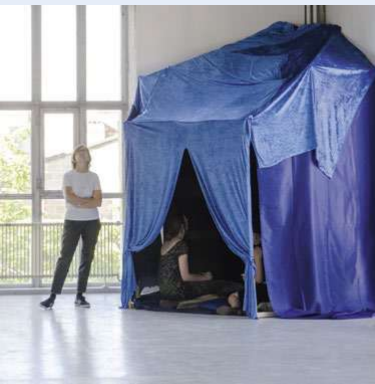
© Jules Baudrillard, diplômé de l'EBABX