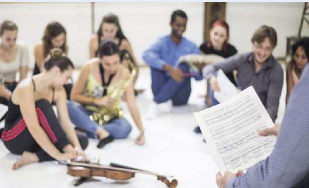
PESMD © Jérémie Mazeng