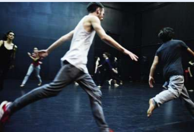
éshba © Antoine Delage